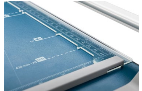
Dahle Rollenschneider 508 (Generation 3) - nützliche Formatlinien und die Pressschiene mit Markierungshilfen erleichtern das Ausrichten des Schnittgutes