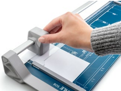
Dahle Rollenschneider 508 (Generation 3) - kinderleichte Bedienung mit zwei Fingern durch verbesserte Messerkopf-Ergonomie