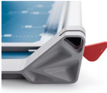
Dahle Rollenschneider 508 (Generation 3) - einfacher Messerkopf-Tausch mit unverlierbarer Verriegelung