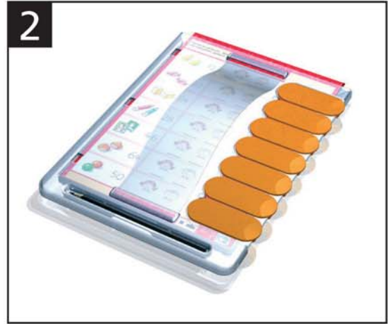
2 Lernstreifen darüber legen