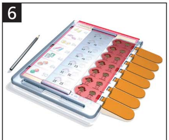
6 Lösungsübersicht - Gesamtkontrolle